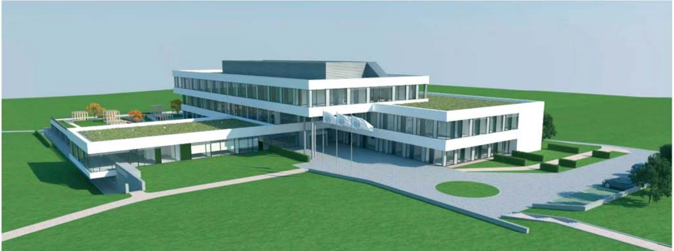
Visualisierung des neuen Herz-Neuro-Zentrums auf dem "Spitalcampus Münsterlingen" mit Blick aus NW

In einer Zeit, in der sich das Schweizer Gesundheitswesen im Umbruch befindet, trifft man auch am Herz-Neuro-Zentrum in Kreuzlingen Vorbereitungen, um den Anforderungen der Zukunft gerecht zu werden. Mit dem Ziel einer zukünftig noch leistungsfähigeren und interdisziplinären Gesamtversorgung der regionalen Patienten ist auf dem "Spitalcampus Münsterlingen" ein moderner Neubau geplant.