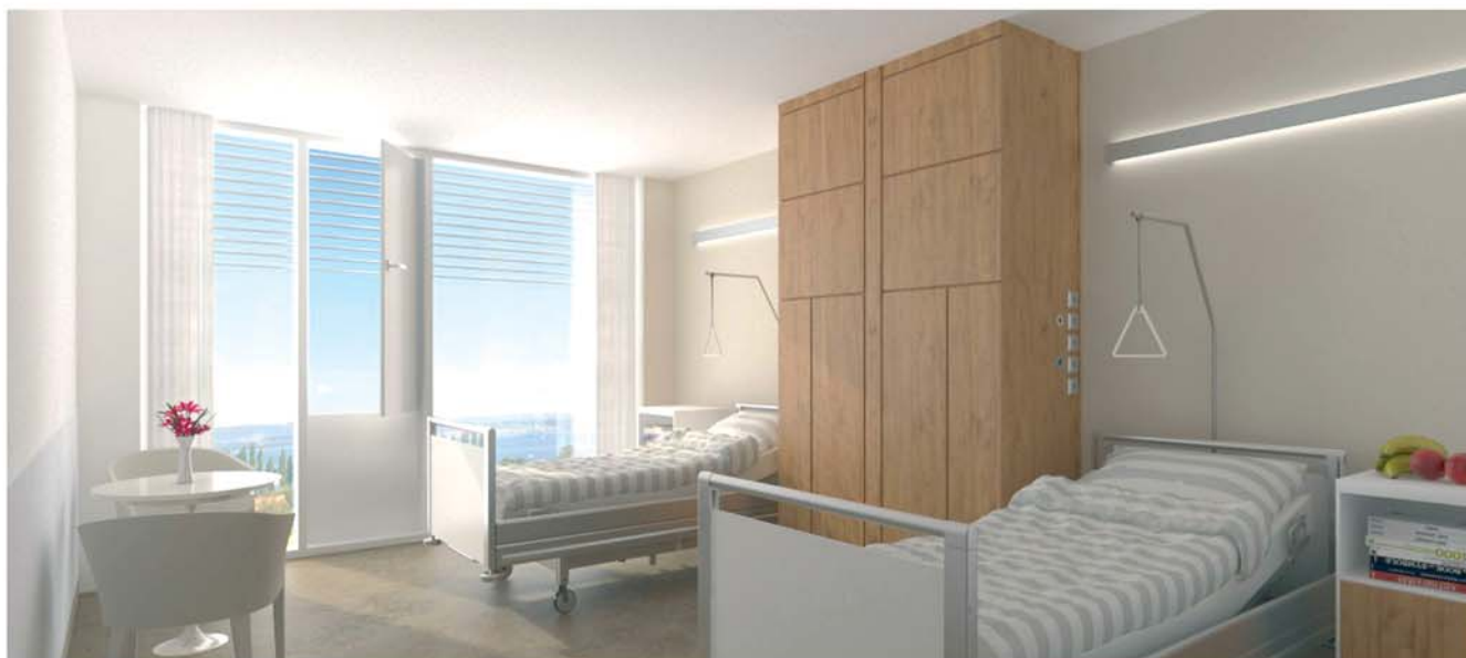
Patientenzimmer im Herz-Neuro-Zentrum mit Blick auf den Bodensee

Hier werden Patienten mit schwersten Erkrankungen aus den Bereichen Neurologie, Neurochirurgie und Neurotraumatologie intensivmedizinisch und rehabilitativ behandelt.